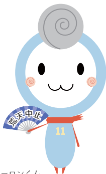
ハーロンくん 伊勢ギーク・フェア 公式キャラクター

伊勢 楽市 11月1日・2日に外宮バス 停前広場周辺で行われる予 定の伊勢楽市にも出展いた します！伊勢楽市会場「伊勢ギーク・ フェアブース」といせシティプラザで 開催される「伊勢ギーク・フェア」を 合わせてお楽しみください。